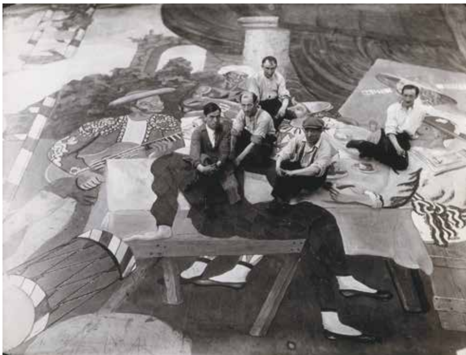
Picasso et ses assistants sur le rideau de Parade en cours de réalisation